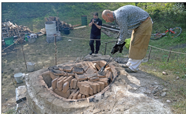
Obr. 11: Vybírání cihelné vsázky po částečném vychladnutí pece.