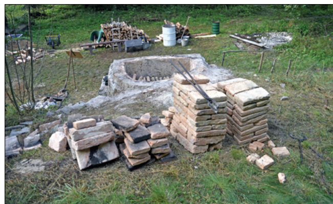
Obr. 12: Výsledná produkce vypálených a částečně nedopálených cihel.