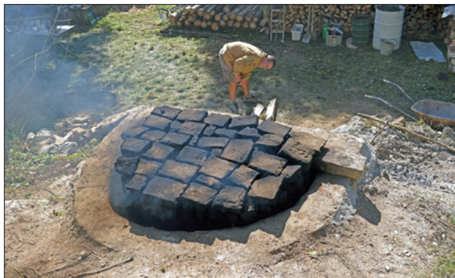
Obr. 7: Pec ve výtopném režimu.