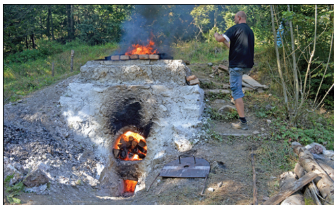
Obr. 9: Pec ve vypalovacím režimu.