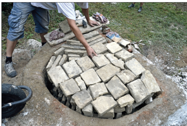
Obr. 6: Pokrývání cihelné vsázky svrchní vrstvou zlomkových cihel.