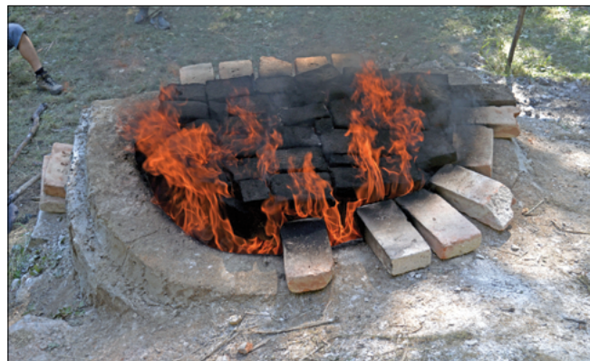
Obr. 8: Roztopená pec v předkalcinačním režimu vápencové vsázky.