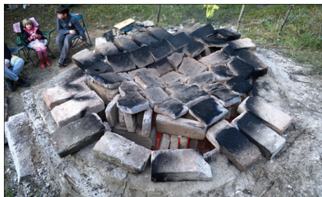
Obr. 10: Pec před koncem výpalu.