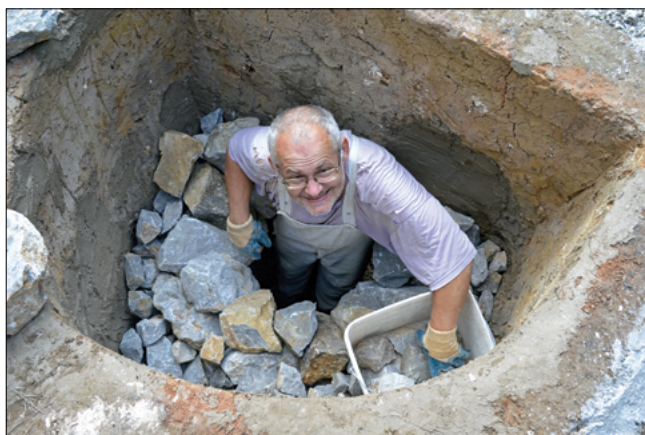
Obr. 3: Ruční stavba klenební vsázky bez podpory.