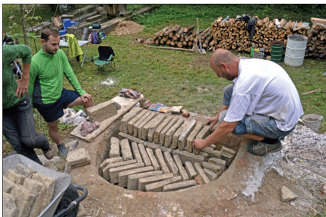
Obr. 5: Štosoání sušených cihel do pece.