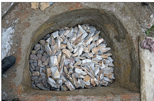
Obr. 4: Střední vsázka krystalického vápence.