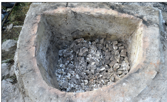
Obr. 13: Vybírání střední vápenné vsázky.