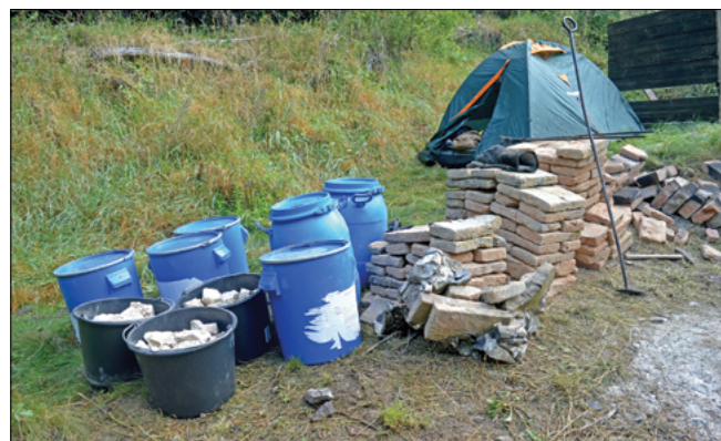
Obr. 14: Část výsledné produkce kombinovaného výpalu: nádoby s kusovým páleným vápnem, defektní a kvalitní cihly.