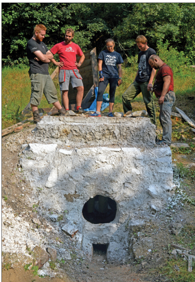
Obr. 2: Pec po rekonstrukci připravená k výpalu.