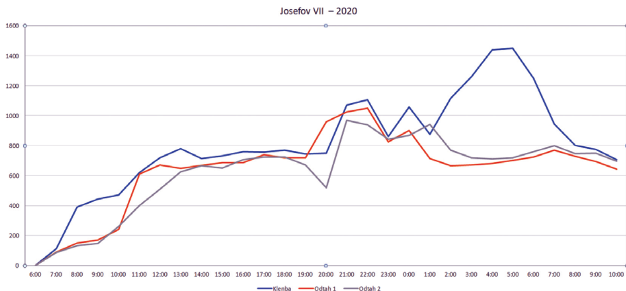
Graf 1: Orientační teplotní graf výpalu kombinované vsázky vápence a cihel na Staré huti u Adamova v roce 2020 (měřeno termopistolí Thermometer Voltcraft IR – 1600A). Výsledné opticky měřené hodnoty jsou orientačního charakteru; vůdčí je teplota měřená ve vápencové klenbě. Sestavil: P. Kos